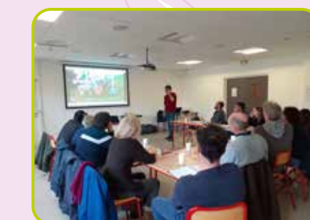
Formation désherbage mécanique