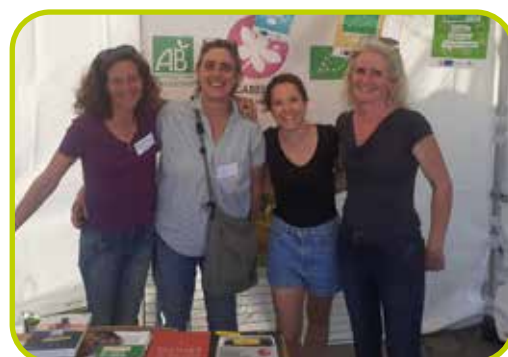
Journée Développement Durable de Chartres Métropole