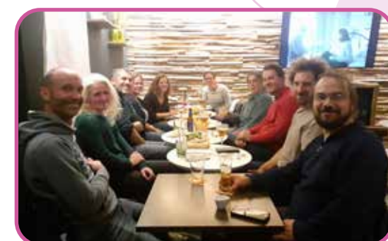
Apéro du GABEL