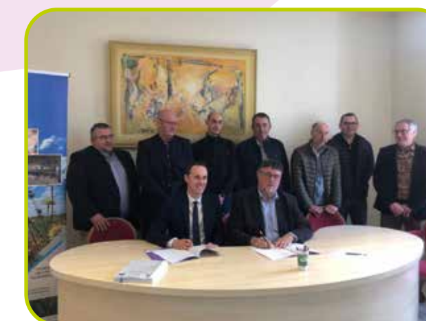
Signature du contrat territorial des Prés Nollets sur Bonneval