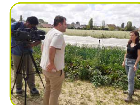
Interview France 3 sur l'aide d'urgence