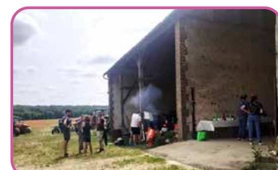
Barbecue de fin de campagne