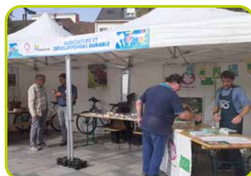
Stand à la Journée du Développement Durable de Chartres Métropole