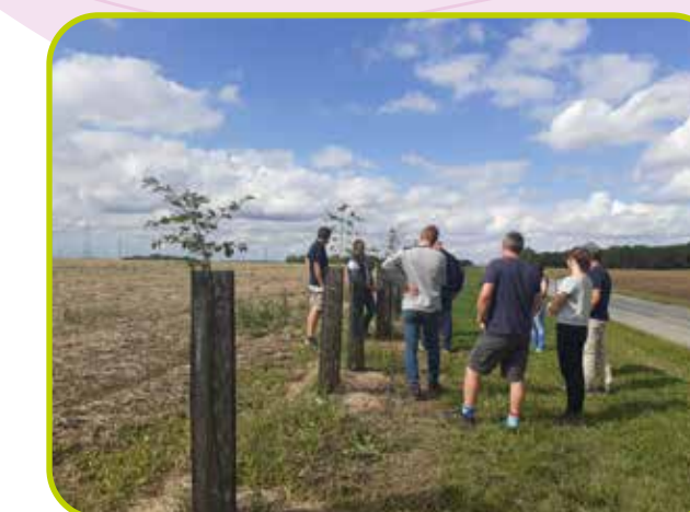
Journée technique sur l'Agroforesterie co-organisée avec Chartres Métropole