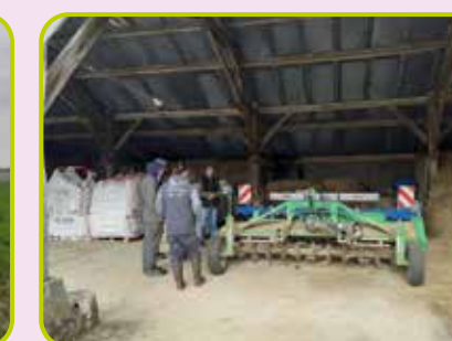
Tour de plaine "couverts végétaux" chez A. Dupuy