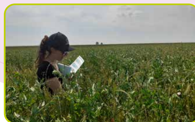
Suivi de parcelles