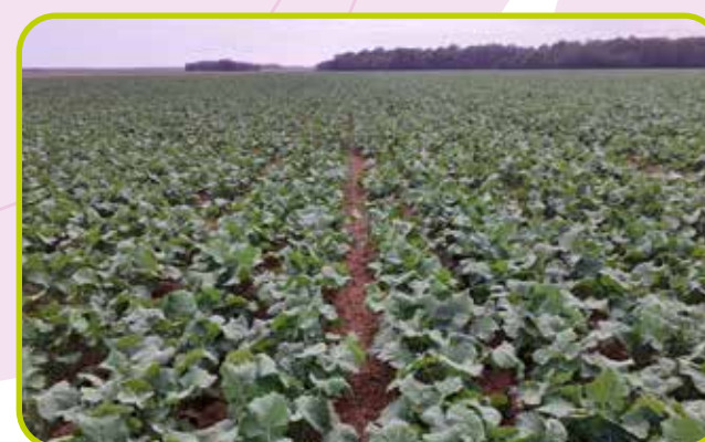
Suivi de parcelles en colza bio