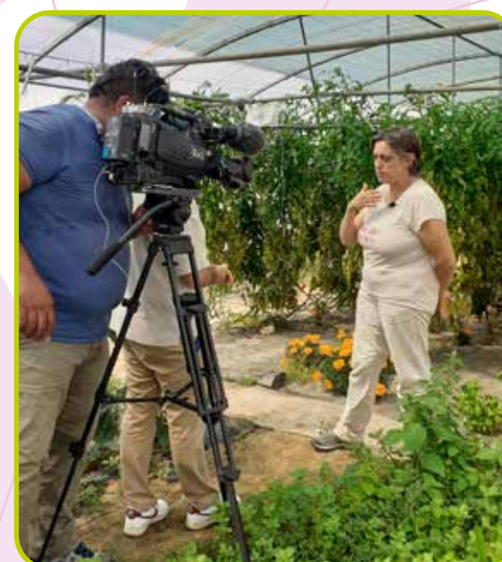
Interview France 3 Centre-Val de Loire sur l'aide d'urgence