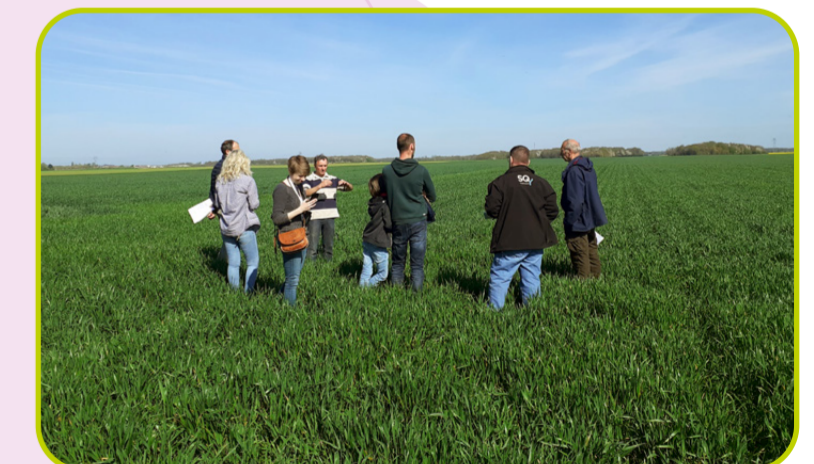
tour de plaine à Dreux