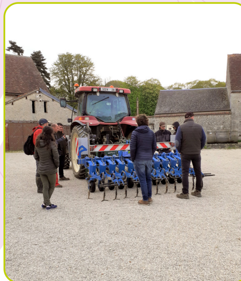
démonstration désherbage mécanique à la Saussaye