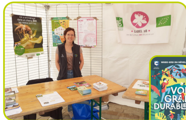
stand du Gabel Week-End du développement durable de Chartres Métropole