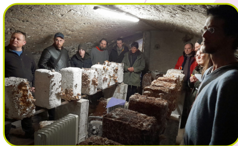
rencontres thématiques production de champignons de Paris