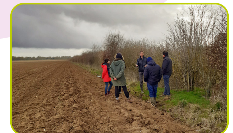
sensibilisation à l'agroforesterie