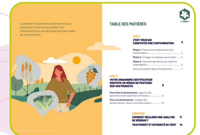
Kit gestion de la contamination n° 2 de la FNAB